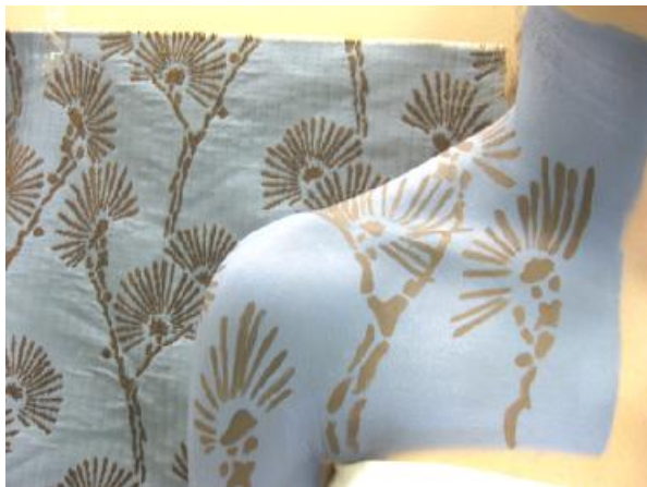
Réalisation en art et maquillage